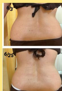
前回の引き締めコースご利用のお客様 (1か月) ウエスト-6センチ