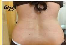
引き締めコースご利用 ウエスト-6センチ