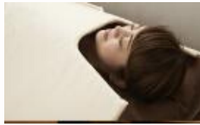
遠赤マットで寝てる だけで痩せ体質へ